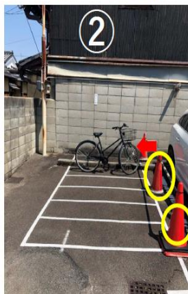
② 白線内のコーン(赤色)の内側に整列してご利用下さい。