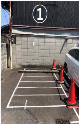
① 白線内に、駐輪をお願い致します。 (奥側からの駐輪にご協力下さい。)