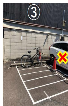
③ 隣に駐車されている車に当たらないように、十分ご注意下さい。