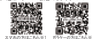
スマホの方はこちら※1 ガラケーの方はこちら※2